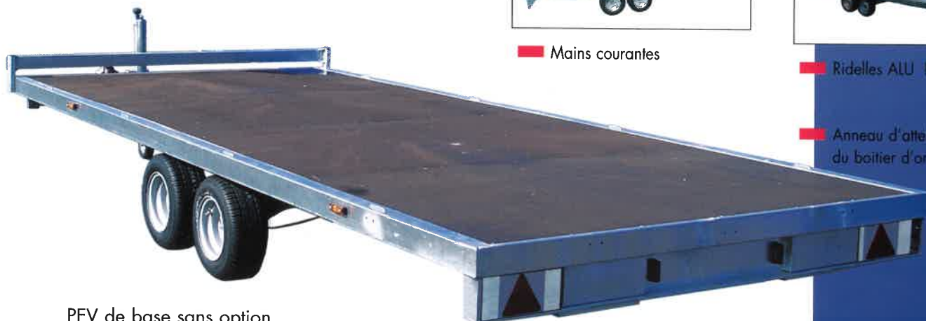
PEV de base sans option

■ Anneau d'attelage à la place du boîtier d'origine